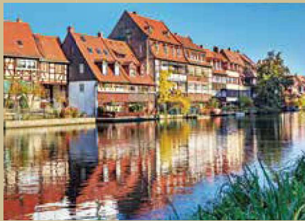
“水の都”と呼ばれるバンベルク

マイン河流域には、ドイツの歴史上重要な役割を果たした街が今も変わらず残っています。東西交易の要衝ローテンブルクや神聖ローマ皇帝が住んだニュルンベルク、1000年の歴史を誇るバンベルクなど、中世の物語絵巻を見ているようです。