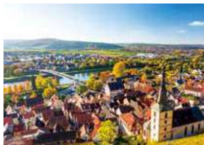
古くからの街並みが多いマイン河畔