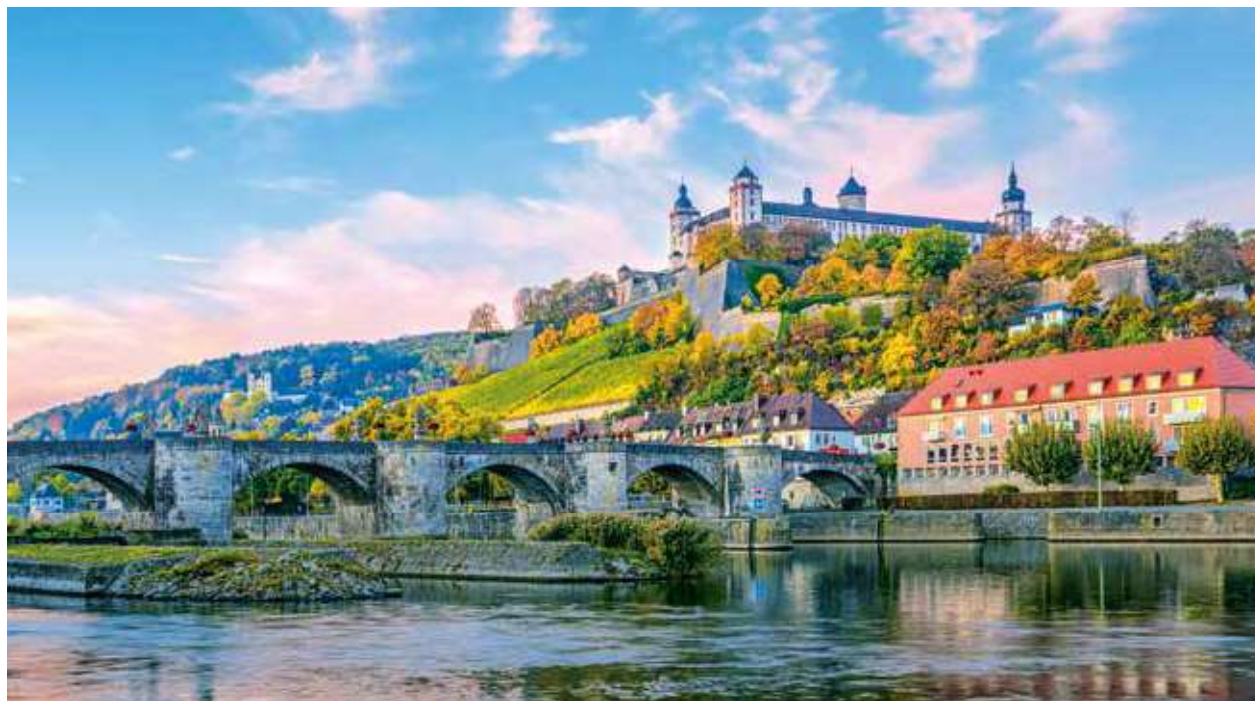
黄葉に染まるマイン河畔の街 ヴェルツブルク

ライン河はアルプス山脈に端を発し、北海へと流れる国際河川。一方マイン河は、ドイツ国内のみを流れる河としては最長。このふたつの河を航行し、世界遺産の古城溪谷や、河畔に点在するいにしへの都の魅力をご堪能ください。今回は、特別企画としてレーゲンスブルクを中心に活躍するアカペラ四重唱チームによる船上コンサートをお楽しみいただきます。