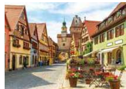
中世当時の街並みを残すローテンブルク