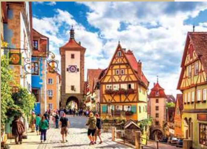
多くの旅人を魅了してきたローテンブルク