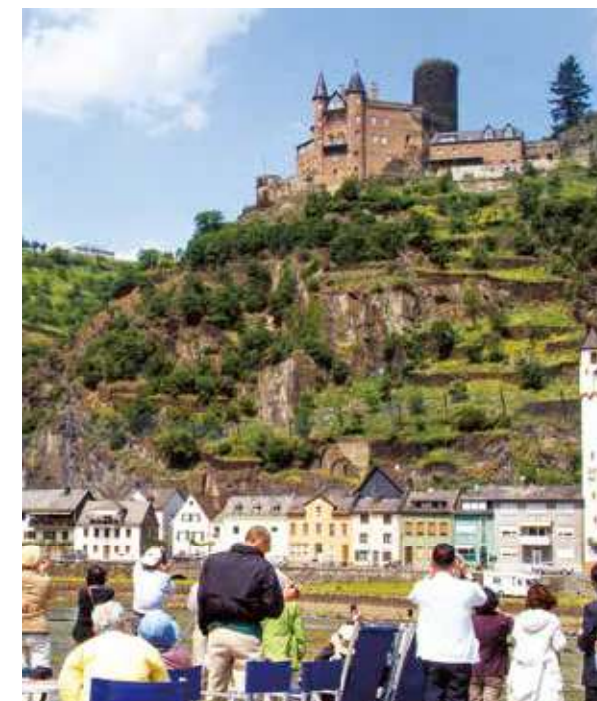
世界遺産のライン古城溪谷をセレナーデより眺める