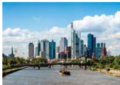
大都会フランクフルトも航行