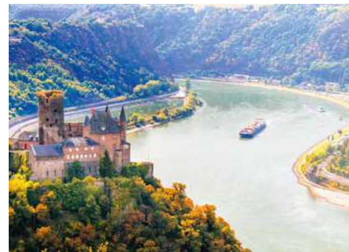
旅のハイライト、ライン古城溪谷クルーズ