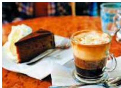
ウィーンのカフェでのんびり過ごしてみても