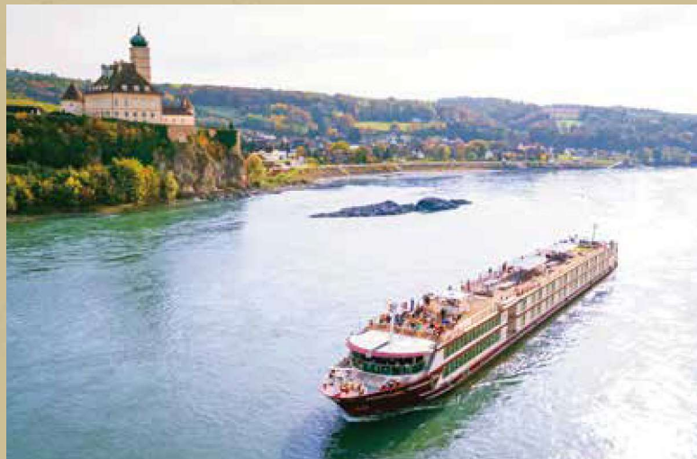
世界遺産バッハウ渓谷