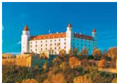
黄葉に染まるブラチスラバ城