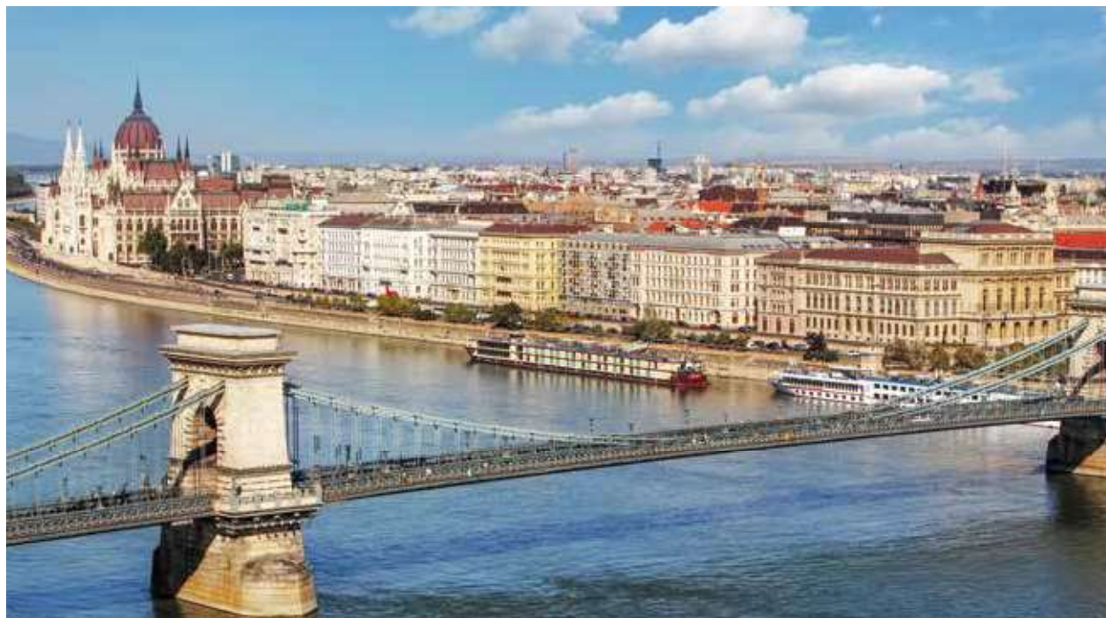
“ドナウの真珠”ブダペストに停泊するセレナーデ号

全長2,850kmの流れの中で、ドイツからハンガリーのブダペストまでの航路は、華やかな都市が多く、見どころにあふれています。今回は特別企画として、ドナウ河クルーズの全出発日で、船上でのウィーン・フィルメンバーによる四重奏コンサートをお楽しみいただけます。