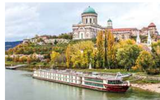
エステルゴム大聖堂前に停泊するセレナーデ号

スイート客室、シングル客室もございます。客室数に限りがありますので、ご希望の方はお早めにお問合せください。