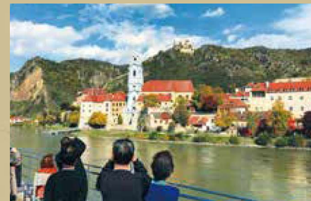
バッハウ渓谷沿いの小さな街デュルンシュタイン