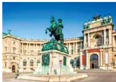
ハプスブルク家の王宮(ウィーン)