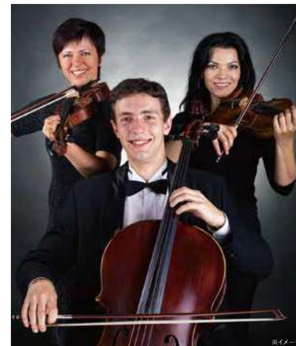
伝統あるウィーン・フィルの音楽を船上で